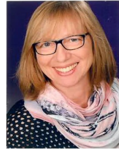
Leitung: Christine Jansen

Zum Einstimmen werden kleine Geschichten vorgelesen, wir hören leise Entspannungsmusik und lassen uns so in die Welt der Farben entführen.