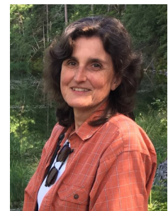
Leitung: Doris Spanbald-Albert

Knackiges Gemüse und Salate machen es uns leicht, den Frühling willkommen zu heißen. Wir wollen an zehn Abenden miteinander kochen.