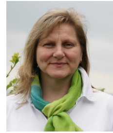
Leitung: Juliane Wolf